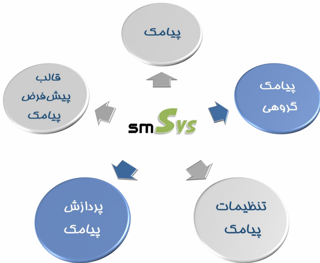
نمای گرافیکی از موجودیت‌های راهکار smSys

این راهکار از ۵ موجودیت اصلی شامل پیامک (SMS)، پیامک گروهی (Bulk SMS)، تنظیمات پیامک (SMS Setting)، پردازش پیامک (Processes SMS) و قالب پیش فرض پیامک (SMS Templates) تشکیل شده است. همچنین موجودیت‌های این راهکار با چندین موجودیت پیش فرض CRM از جمله اشخاص (Contacts)، شرکت‌ها (Accounts)، سرخ‌ها (Leads)، کاربران (User) و به‌طور کلی با تمامی موجودیت‌هایی که با Activity مرتبط است، دارای ارتباط می‌باشند.